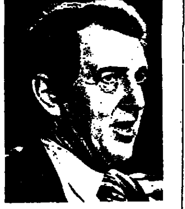
السيد فؤاد بطرس وزير الخارجية اللبناني

الجنة قد عقدت اجتماعاً برئاسة النائب فؤاد لحود وحضرها الدكتور سليم الفاضل رئيس الحكومة والسيد عبد الرحمن وزير الدفاع العقيد عباس حيدان ، وقد استمرت الجهود المكثفة امس على مخطف الاسويين لمعالجة التدهور الامني في العاصمة اللبنانية في اعقاب الاشتباكات الدموية التي اندلعت امس الاول في المنطقة الشرقية واستمرت عن وقوع خسائر غادحة في الارواح لدى الطرفين المتنازعين . وقد اجتمع الشيخ بيير الجميل رئيس حزب الكتائب ظهر امس مع السيد كميل شمعون رئيس حزب الوفاقين لاجراء بحث للنيل الكثرة بتطويق الاشتباكات بين اقسام حزبيها . واعلان راديو بيروت انه تم خلال الاجتماع الاتفاق على تشكيل لجان هذه الفواض مؤقتة ولن يمتنع الشفاء التام .